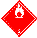
Etiquette 2.1 : gaz inflammable.