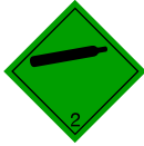
Etiquette 2.2 : Gaz non inflammable et non toxique.