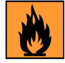
F+ : Extrêmement inflammable