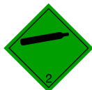
Etiquette 2.2 : Gaz non inflammable et non toxique.